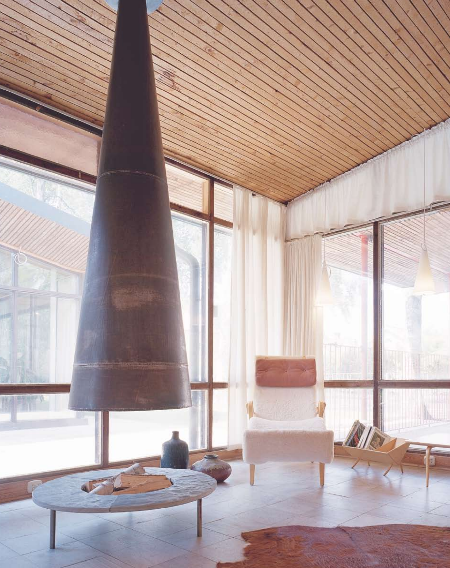
T.V. HÖRN AV UTSTÄLLNINGSHALLEN. I BAKGRUNDEN SKYMTAR TILLBYGGNADEN FRÅN 1993.